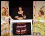
XXIV Concurs de Grups Amateurs de Teatre: L'Hostalera Tàrraga, dia 25 de febrer