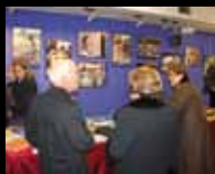
Festivitat de Sant Antoni de la Sitja Bellpuig, dia 19 de febrer

FEBRER · NÚM. 168 · REVISTA MENSUAL COMARCAL